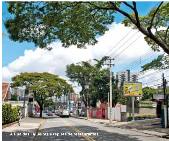
A Rua das Figueiras é repleta de restaurantes

CAPA FOTO: DIVULGAÇÃO. IMPRESSÃO LEOGRAF – GRÁFICA E EDITORA LTDA. ESTE GUIA FOI IMPRESSO EM PAPEL COUCHÉ 150 G/M 2 (MIOLÃO) E 230 G/M 2 (CAPA). TIRAGEM 1.000 EXEMPLARES. TODOS OS DIREITOS RESERVADOS. PROIBIDA A REPRODUÇÃO SEM AUTORIZAÇÃO PRÉVIA E ESCRITA. TODAS AS INFORMAÇÕES TÉCNICAS SÃO DE RESPONSABILIDADE DOS RESPECTIVOS AUTORES. PUBLICADO EM NOVEMBRO DE 2011.