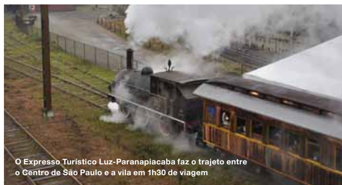
O Expresso Turístico Luz-Paranapiacaba faz o trajeto entre o Centro de São Paulo e a vila em 1h30 de viagem

Localizado dentro da Craisa – Companhia Regional de Abastecimento Integrado de Santo André (Av. dos Estados, 2195, Santa Terezinha, tel. 4996-9500), o espaço de 900 m 2 abre somente nas manhãs de quartas e sábados para a venda de mais de 200 espécies de flores, plantas ornamentais e mudas de árvores frutíferas. No mesmo endereço, a clientela encontra todo tipo de acessório para a prática de jardinagem e paisagismo. Além da incrível variedade de produtos, os preços baixos são outro grande chamariz: atraídos pelas pechinchas de ocasião, profissionais da área visitam o lugar regularmente. Mas é preciso acordar cedo: o mercado funciona das 5 horas da madrugada até às 11.