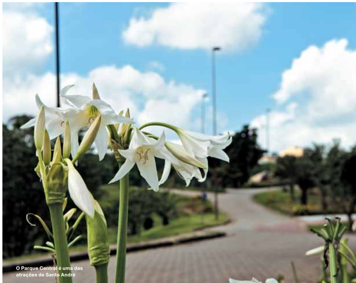
O Parque Central é uma das atrações de Santo André