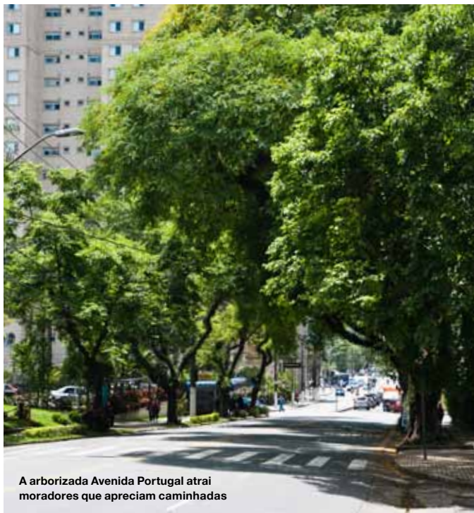
A arborizada Avenida Portugal atrai moradores que apreciam caminhadas

Com 2 km de extensão, a Avenida Portugal se transformou, nos últimos anos, em ponto de encontro do mundo da arquitetura e do design de interiores. A via, que começa ao lado do Paço Municipal e termina no aprazível bairro Jardim Bela Vista, concentra um grande número de lojas de decoração, dos mais variados estilos. Percorrê-la a pé é uma delícia. Arborizada e plana em boa parte do percurso, convida os moradores a longas caminhadas, com paradas estratégicas nos cafés.