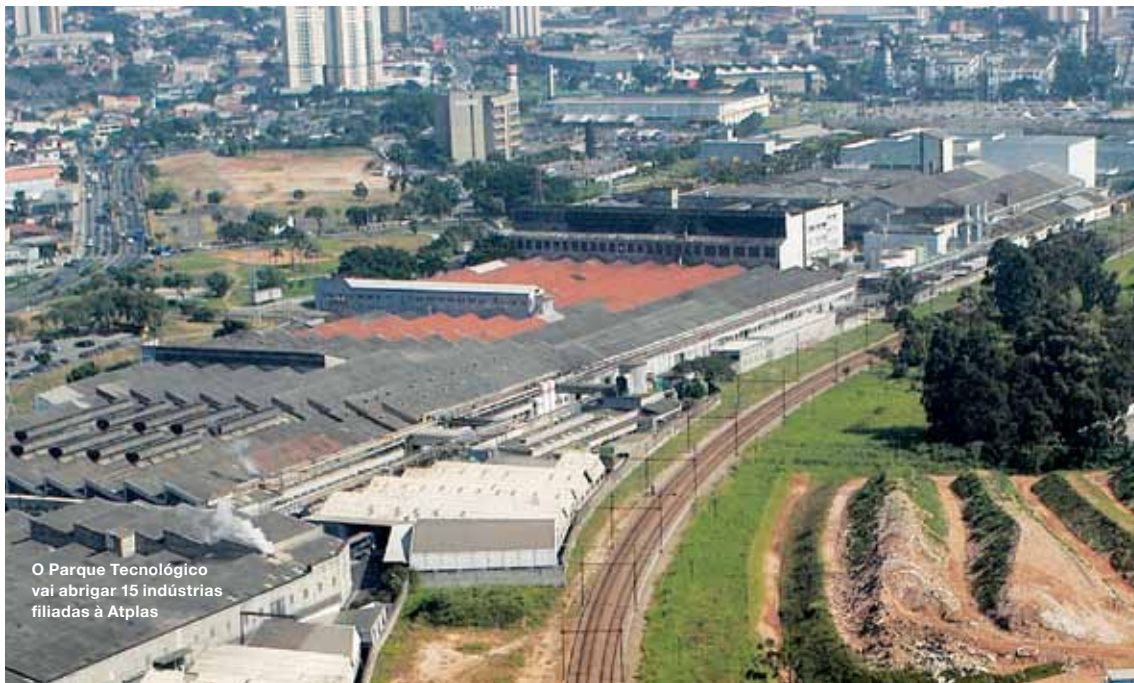
O Parque Tecnológico vai abrigar 15 indústrias filiadas à Atplas

PARA OS PRÓXIMOS ANOS, SANTO ANDRÉ ESPERA NOVIDADES GRANDIOSAS – E SE PREPARA PARA AUMENTAR AINDA MAIS A SUA IMPORTÂNCIA NA ECONOMIA DO ESTADO