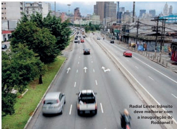
Radial Leste: trânsito deve melhorar com a inauguração do Rodoanel I

Belém é cortado por três avenidas fundamentais (Marginal do Tietê, Celso Garcia e Radial Leste ) e tem fácil acesso para estradas importantes, como a Dutra, a Fernão Dias e a Ayrton