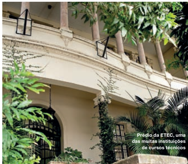
Prédio da ETEC, uma das muitas instituições de cursos técnicos