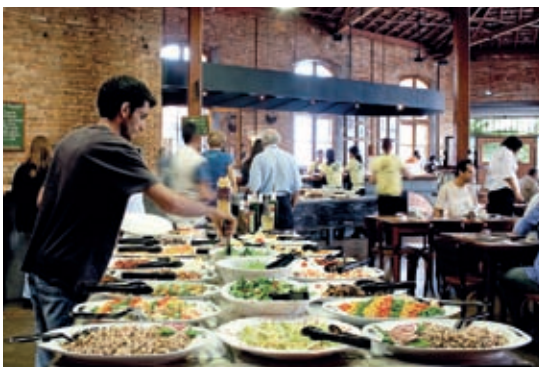
Restaurante Santa Rosa do Brás, instalado em um antigo galpão

A região do Belém mantém preservados muitos prédios tombados pelo Patrimônio Histórico do primeiro período da industrialização do país. Um exemplo é o restaurante Santa Rosa do Brás , que pertenceu à família Matarazzo e foi um antigo galpão do grupo. Já onde funcionava o cotonifício Crespi agora é um hipermercado Extra, na Rua Taquari. A história industrial também está presente no vizinho Brás: onde