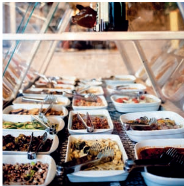
Mesa de antepastos da pizzaria Castelões