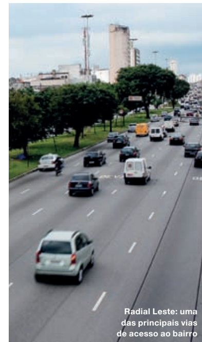
Radial Leste: uma das principais vias de acesso ao bairro

Mas o Belém não é só passado: também acompanha com desenvoltura o crescimento dos vizinhos Mooca e Tatuapé. E o que é melhor: sem perder a tranquilidade e o jeito pacato de bairro tão raro de se ver em outras localidades de São Paulo.