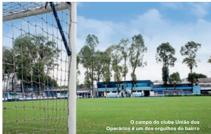
O campo do clube União dos Operários é um dos orgulhos do bairro

hoje fica a Central Única dos Trabalhadores (CUT) aconteceu a primeira greve do país, em 1917 ( leia mais em Comer, pág.22 ).