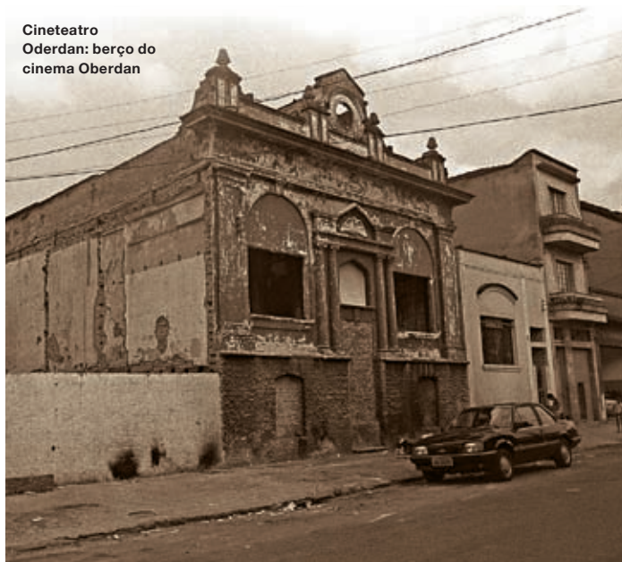
Cineteatro Oderdan: berço do cinema Oberdan