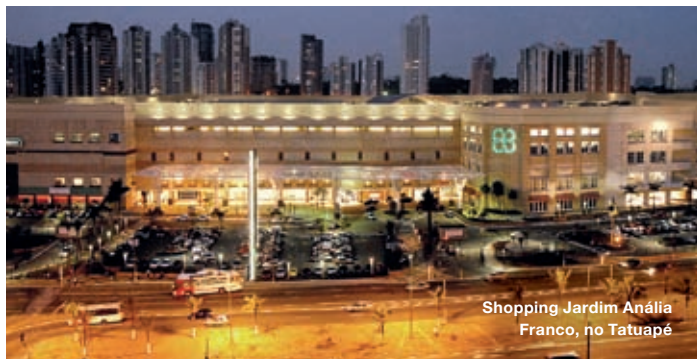
Shopping Jardim Anália Franco, no Tatuapé