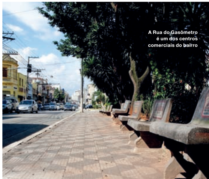
A Rua do Gasômetro é um dos centros comerciais do bairro

Senna. Além disso, quem usa transporte público também conta com o metrô Belém e o Bresser (Linha Vermelha), e a estação ferroviária do Brás (por onde passam os trens para o extremo leste da capital paulista, como Mogi das Cruzes e ABC Paulista), que fica bem perto.