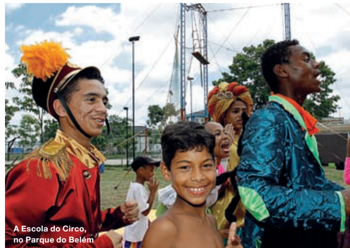
A Escola do Circo, no Parque do Belém

Por enquanto, é apenas um estudo da prefeitura, mas a ideia de construir um monotrilho elevado na Avenida Celso Garcia promete melhorar – e muito! – a velocidade de deslocamento e a qualidade do transporte público entre o Centro e o bairro da Penha.