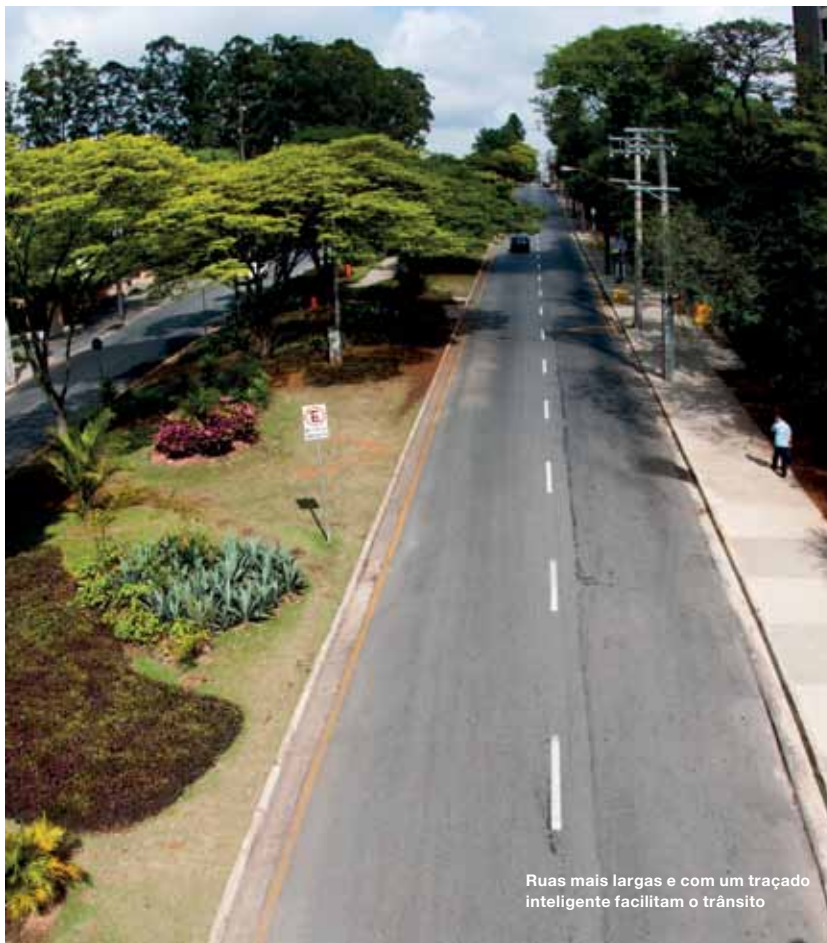
Ruas mais largas e com um traçado inteligente facilitam o trânsito