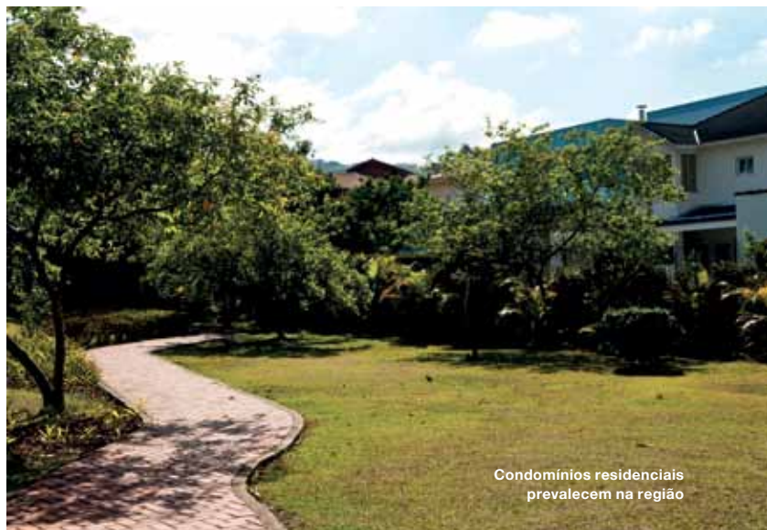
Condomínios residenciais prevalecem na região

CAPA FOTO: GABRIEL CAPPELLETTI. IMPRESSÃO LEOGRAF – GRÁFICA E EDITORA LTDA. ESTE GUIA FOI IMPRESSO EM PAPEL COUCHÉ 150 G/M 2 (MILOLO) E 230 G/M 2 (CAPA). TIRAGEM 2 MIL EXEMPLARES. TODOS OS DIREITOS RESERVADOS. PROIBIDA A REPRODUÇÃO SEM AUTORIZAÇÃO PRÉVIA E ESCRITA. TODAS AS INFORMAÇÕES TÉCNICAS SÃO DE RESPONSABILIDADE DOS RESPECTIVOS AUTORES. PUBLICADO EM NOVEMBRO DE 2011.