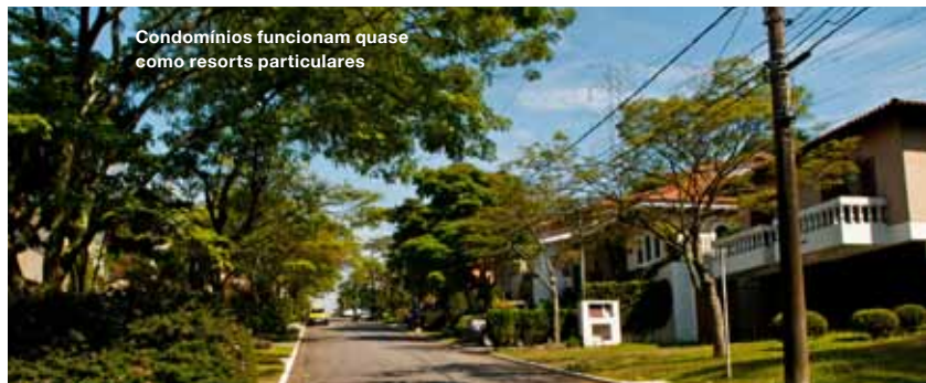
Condomínios funcionam quase como resorts particulares

e playground, vem turbinado com facilidades como spas, quadras para diversas modalidades esportivas e até bosques. Todo esse luxo não pesa no bolso. O preço do metro quadrado, assim como as taxas de condomínio, saem em média pela metade (às vezes, por um terço) dos valores praticados em áreas nobres de São Paulo.