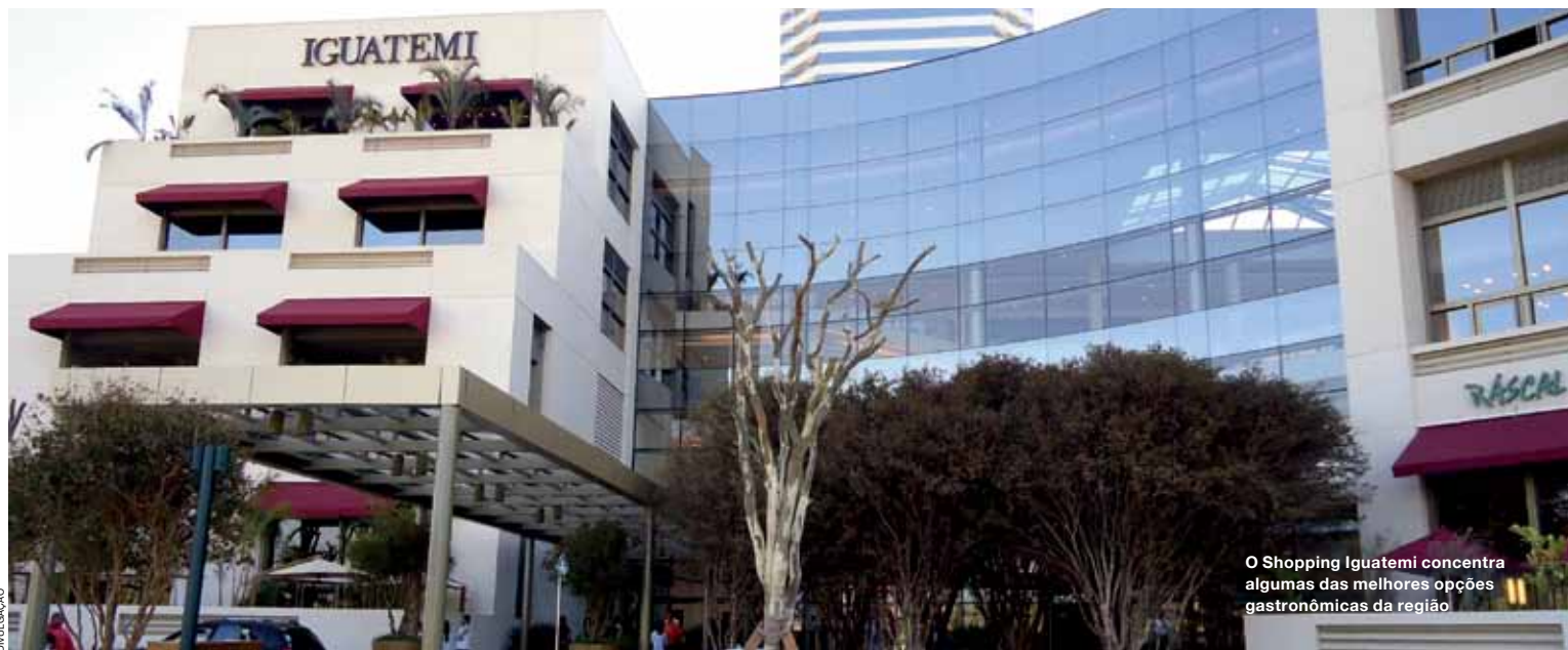
O Shopping Iguatemi concentra algumas das melhores opções gastronômicas da região

mais baixo, em média, do que os preços praticados em áreas nobres da capital. E, claro, pela clientela qualificada que o lugar oferece. A gigantesca população flutuante comprova que Alphaville se tornou um polo de bons negócios – 155 mil pessoas trabalham na região, um time bem maior do que os 43.500 moradores.