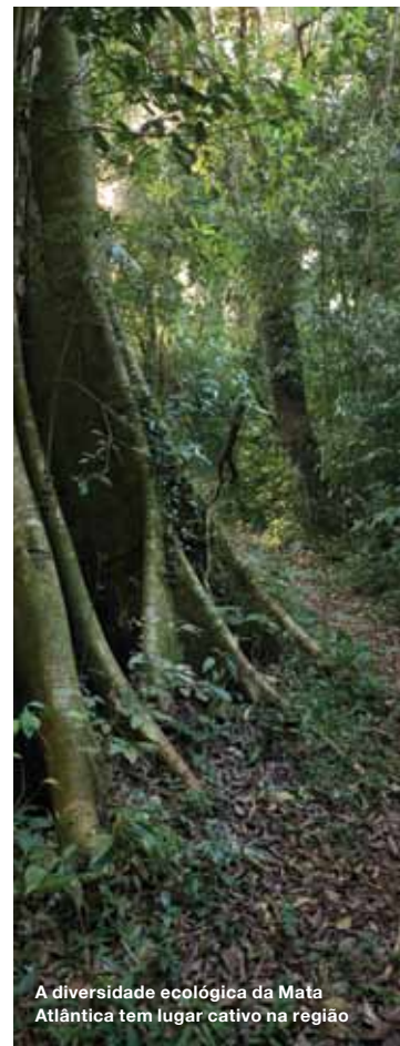
A diversidade ecológica da Mata Atlântica tem lugar cativo na região

A Reserva Biológica Tamboré, com 3,6 milhões de m 2 , é hoje uma das maiores unidades urbanas de preservação ambiental de todo o país – e o pulmão de Alphaville e arredores. Localizada no município de Santana do Parnaíba, a área reúne 18 nascentes, 193 espécies vegetais típicas da Mata Atlântica e nada menos do que 111 espécies de aves. Outra importante área verde da região, o Parque Ecológico do Tietê – Núcleo Tamboré, ocupa 1,5 km 2 e recebe 15 mil visitantes por mês. Voltado exclusivamente ao lazer e à educação ambiental, tem como missão preservar a flora e a fauna silvestres da várzea do Rio Tietê. Suas trilhas podem ser percorridas por turmas escolares e grupos fechados, na companhia de monitores. Para o público em geral, há atrações como campos de futebol, quadras poliesportivas e um lago com pedalinhos.